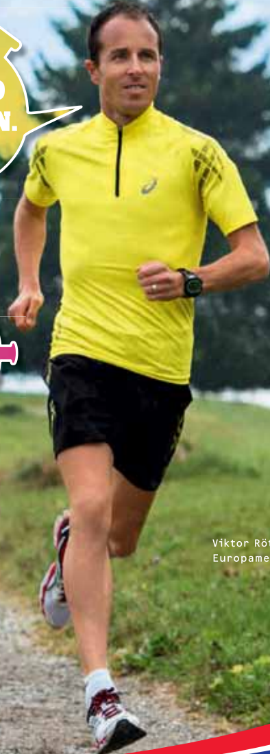
Viktor Röthlin, Europameister Marathon